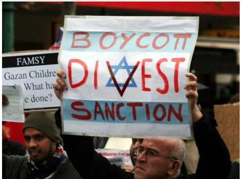
מפגינים אוסטרלים קוראים לחרם על ישראל

אם המילה "חשמל" נשמעת לכם מוכרת בהקשר הפלסטיני זה נובע כמובן מהעובדה שזה אותו חשמל שמדינת ישראל מספקת להם. אותו חשמל ישראלי שהפלסטינים, במשך שנים, לא בדיוק משלמים עליו. במילים אחרות, את ההנחה בחשבונות החשמל שמקבלים הסוחרים הפלסטינים שמחרימים סחורה ישראלית הם למעשה מקבלים מישראל. זה נובע מכך שמדובר בחשמל ישראלי, שניתן לפלסטינים ללא תשלום, כשבסוף הדרך אף מוענקת הנחה לאותם בעלי עסקים שמחרימים את ישראל. אחלה סידור, לא?