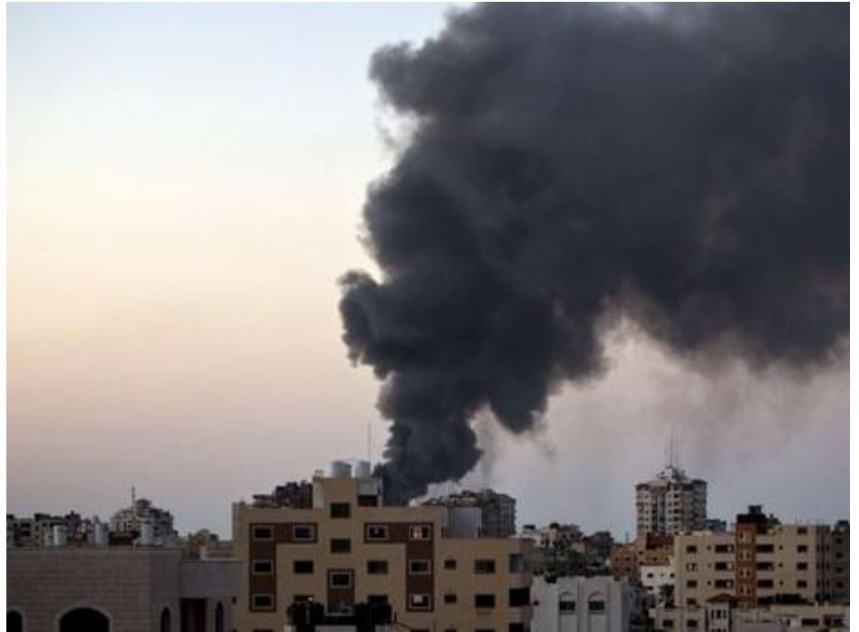
בעיה ארוכת שנים. עזה

משנות ה-90 ואילך התגבשה אצלם אמונה שנסוגה היא הפתרון, אך חפירה במנהרת הזמן מגלה שבעבר הרחוק יותר הם הונעו על ידי אמונה הפוכה לחלוטין. הנחת היסוד אז אמרה שאת רצועת עזה אי אפשר להרגיע בלי לשלוט בה. בן-גוריון, לדוגמה, שלמחרת מלחמת ששת הימים הטיף לנסיגה גורפת תמורת שלום, החריג מההמלצה הזו את ירושלים ואת הרצועה. זאת אף שכבר בזמנו הייתה שם בעיה דמוגרפית קשה.