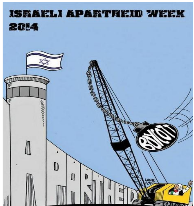
כרזה הקוראת להחרמת ישראל