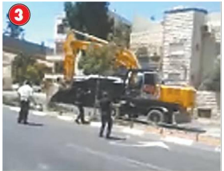
הקצינים יורים צרורות לעבר המחבל ומחסלים אותו