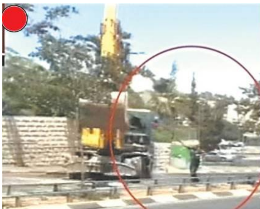
לוחם שב"ס יורה לעבר הדחפור