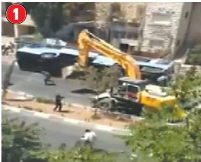
הדחפור מכה באוטובוס בעוצמה והופך אותו