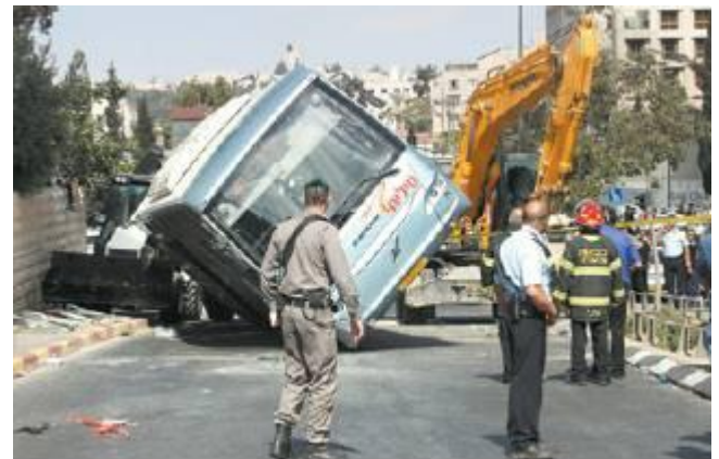
האוטובוס ההפוך. במזל, היה כמעט ריק