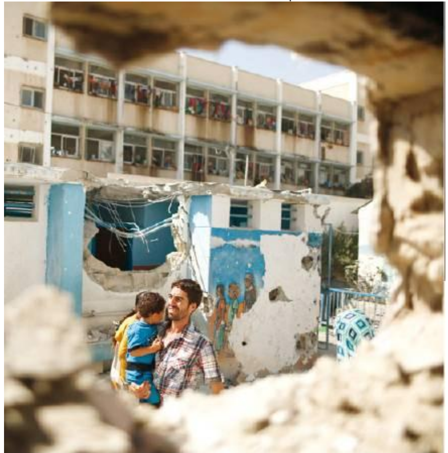
בית הספר ההרוס

הגינניים הקשים יותר הגיעו מכיוון האו"ם. מזכ"ל הארגון באן קי-מוון אמר כי "כל הראיות בנמצא מעידות כי ארטילריה ישראלית היא הגורם להפגזה". לדבריו, "המיקום המדויק של הבית בג'באליה הועבר לישראלים 17 פעמים. אני מגנה את הפעולה הזו בכל החריפות. היא שערורייתית, בלתי מוצדקת והיא דורשת שהצדק ייעשה ושהאחראים עליה ייתנו את הדין." מדובר צה"ל נמסר כי "הטענות מוכרות ונבדקות". בהכנת הידיעה השתתפה לילך שובל