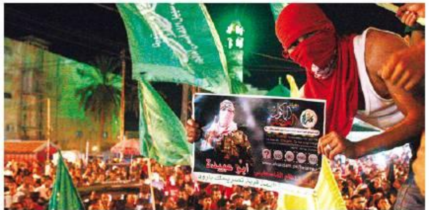
הפגנה בג'נין, שלשום

דובר חמאס בעזה פאזי ברהום אמר כי "העם הפלשתיני בעזה ובגדה מאוחד במלחמתו נגד הכיבוש".