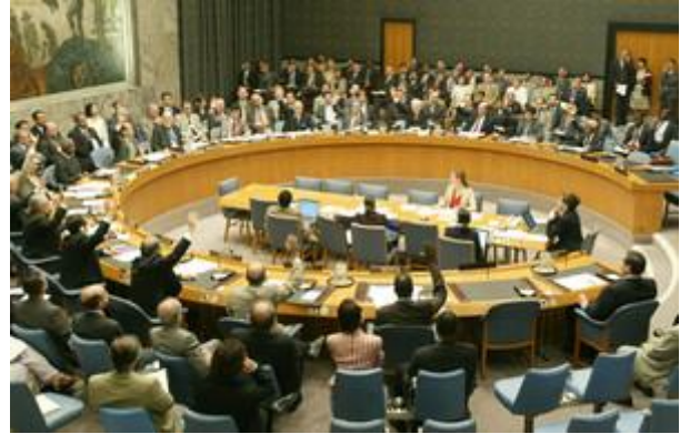
מועצת הביטחון של האו"ם אי-פי

ובכל יום ניתן למנות דוגמאות אשר מוכיחות כי אפליית נשים, עינויים והפרת זכויות הילד הנם חלק מהיום יום ברחוב הפלסטיני.