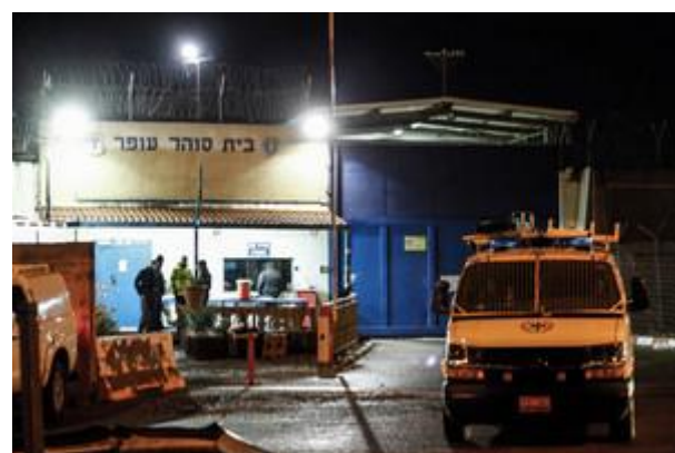
כלא עופר

במילא כעת בידי הממשלה ישנן שתי אפשרויות, לאפשר לאסירים לרעוב עד מוות או לשחררם לבתייהם למרות הפשעים המתועבים שחוללו. ברור ששחרור כזה אינו אפשרי כי הוא מנוגד למוסר הטבעי, מנוגד לחוק בישראל ומנוגד לעצם רצון ההתקיימות הלאומית שלנו בארצנו. לכן המסקנה היחידה מהמצב הנוכחי צריכה להיות: לאפשר לאסירים לרעוב עד מוות. ברור שיש עדיני נפש בתוכנו שיתנגדו למציאות כזו אלא שהטענה כי כוחה של דמוקרטיה הוא בחולשתה, כשמבקרה הזה הכוונה לחלושה שלנו מול שביתת הרעב של האסירים, היא הזיה מזרח תיכונית מסוכנת ביותר.