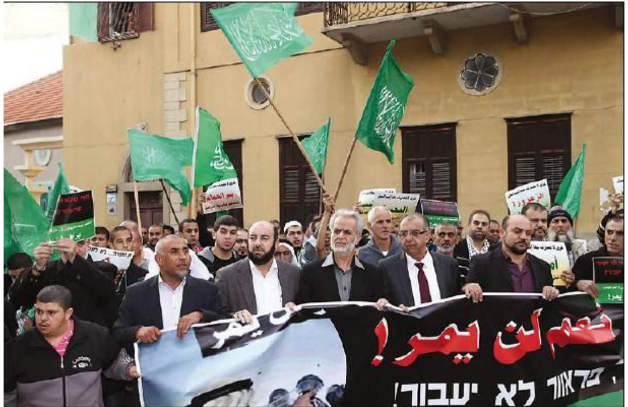
התערבות פוליטיקאים. הפגנה נגד מתווה פראוור